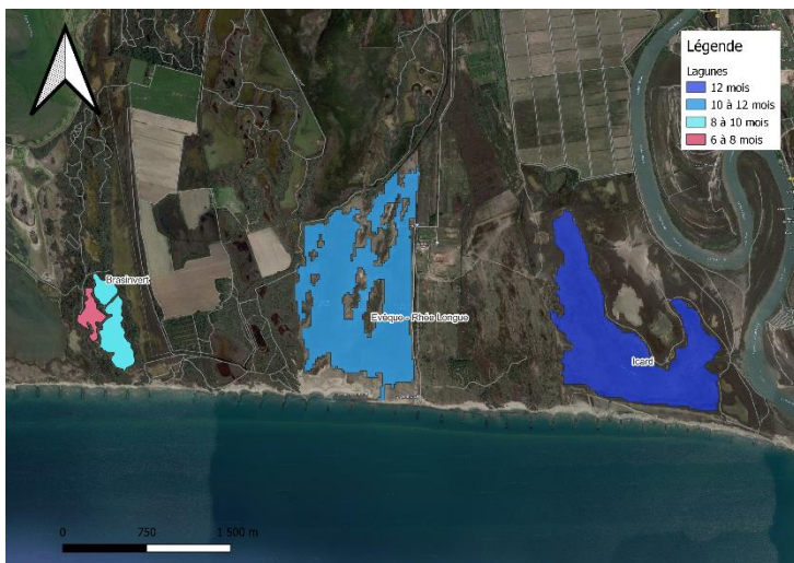
Figure 5 : Localisation des lagunes méditerranéennes soumises à l'étude de leur état de conservation (habitat 1150* Natura2000), OUEST

Le site de Brasinvert se divise en deux (Figure 5), avec une partie de la lagune qui est temporaire, immergée 6 à 8 mois dans l'année et l'autre temporaire immergée 8 à 10 mois par an. La lagune de Baisse de l'Evêque - Grande rhée longue est temporaire, immergée 10 à 12 mois par an, Icard est permanente.