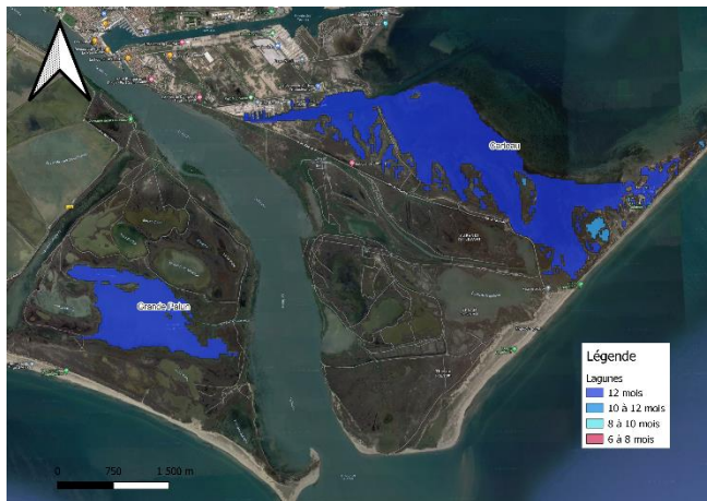
Figure 3 : Localisation des lagunes méditerranéennes soumises à l'étude de leur état de conservation (habitat 1150* Natura2000), EST

Le site des EMSC regroupe des lagunes utilisées historiquement comme marais salants.