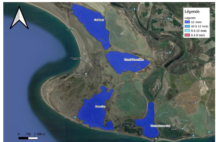
Figure 4 : Localisation des lagunes méditerranéennes soumises à l'étude de leur état de conservation (habitat 1150* Natura2000), EMSC

Certaines entités sur site de Carteau font partie du site Natura2000 Rhône Aval (ZSC).